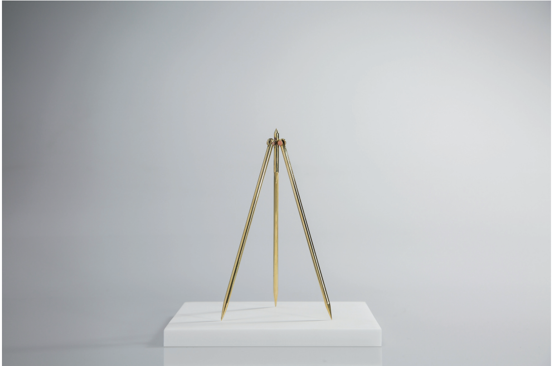
Ludovico Bomben, Studio per compasso a tre gambe 1 (2012). Ottone, rame, 14 × 10 cm