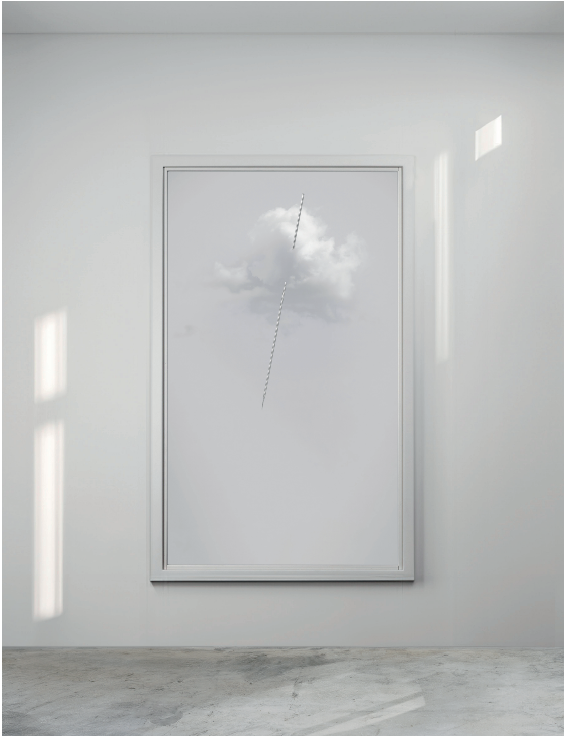
Ludovico Bomben, Nuvola con fendente / 3 (2023). Stampa su carta superior matt, acciaio inox, 176 × 110 cm